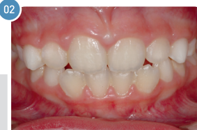
Criança de 7 anos | Depois do uso do aparelho